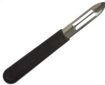
UN ECONOME un économe un économe