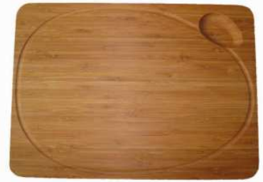
LA PLANCHE A DECOUPER la planche à découper la planche à découper