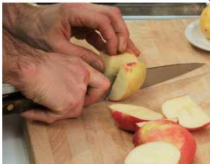
COUPER couper couper