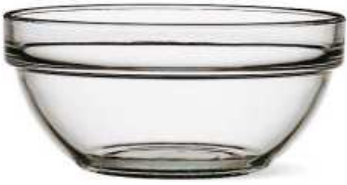
LE SALADIER le saladier le saladier