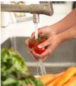
LAVER laver laver