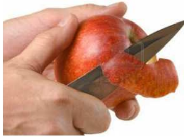
PELER peler peler