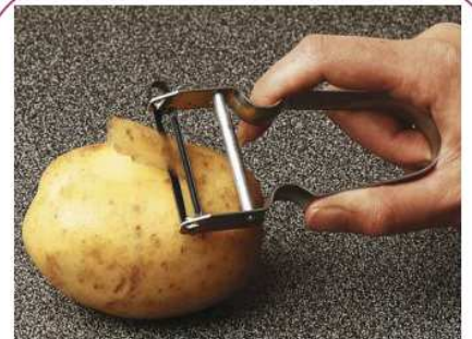
EPLUCHER éplucher éplucher