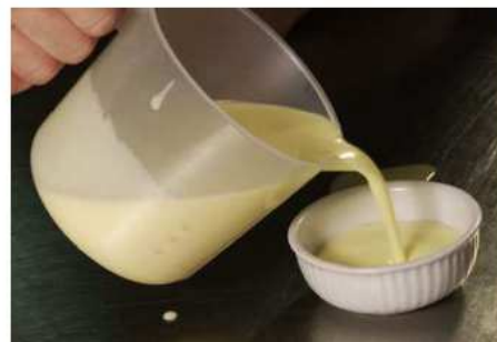
VERSER verser verser