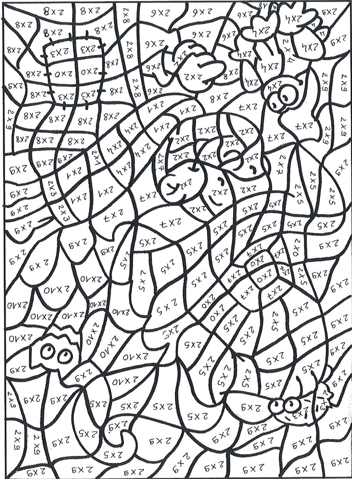
Table de multiplication de 2